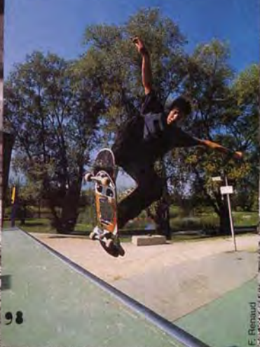
Blunt to fakie sur une mini rampe qu'il voit de la fenêtre de sa chambre.

Bon, c'est fini, tu as un message à faire passer ? Bonjour à tous mes amis et ma famille.